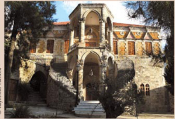
قصر جنبلاط، المختارة

تبعد ٥٠ كلم جنوبي شرقي بيروت، و ٢٩ كلم عن الدامور، و ١٠ كلم جنوبي شرقي بيت الدين. وهي على تقاطع طرق بين عدة قرى في الشوف الأعلى، ما جعلها موقعاً استراتيجياً ومراً بين الشوف وسهل البقاع، وبين الشوف والجنوب. تعلو ٨٥٠ متراً عن البحر. طقسها سانح ربيعاً وصيفاً، ومقبول البرودة شتاءً. فيها ثروة مائية تبلغها من مياه الباروك ووادي الماع، ويلتقي فيها نهران: بركة العروس وبيير البلاط. بلدة أثرية مهمة، حافظت على الطراز التقليدي