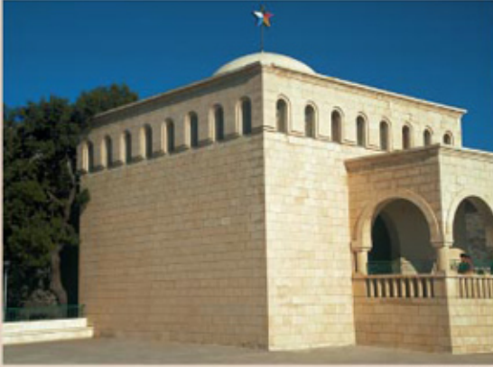
مقام النبي أيوب

٢) مغارة شقيف تيرون: تعلو ١١٠٠ م عن البحر.