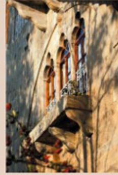
قصر جنبلاط، المختارة

لبيوتهنا، وعلى طرفاتها الداخلية الضيقة. بين بيوتها أدراج حجرية قديمة تتوسطها قنوات المياه. ويقوم الزعيم اللبناني وليد جنبلاط، مساهمةً مع البلدية، بترميم القرية لجعلها قرية نموذجية.