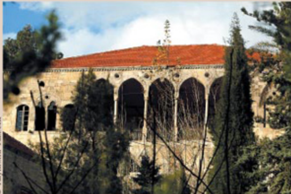
قصر جنبلاط، المختارة

آل جنبلاط: أصل كلمة جنبلاط "جنبلاد" (القلب الحديدي). وكان ابن عرابو (الجد الأول) حاكم معرة النعمان وحلب، وملقباً بـ"أمير الأمراء" لأنه أرسى السلم والازدهار في منطقة حكمه. وحين غضب السلطان العثماني من آل جنبلاط سنة ١٦٠٧ أرسل مراد باشا مخاربتهم فتغلّب عليهم وتشتت الأسرة الجنبلاطية إلى بلاد حلب وكلس. وسنة ١٦٣٠ توجّه جنبلاد بن سعيد بن مصطفى بن حسين باشا بن جنبلاد إلى لبنان (ومعه ابنه رياح) فجعله فخر الدين المعني الثاني